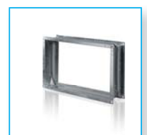
Гибкая вставка ВВ