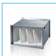
Фильтры ФБ и ФБК