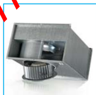
Радиальный вентилятор ВКПФ