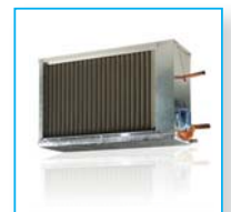
Охладитель водяной / Прямой испаритель ОКВ / ОКФ