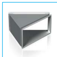
Поворотное колено ПК