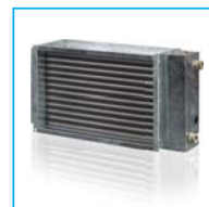
Водяной обогреватель НКВ