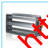
Отсекающая заслонка РРВАФ