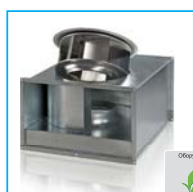
Радиальный вентилятор с ЕС мотором ВКП-ЕС