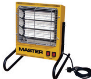
TS 3 A