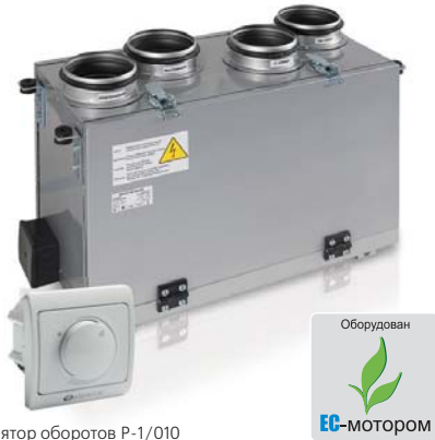
Регулятор оборотов P-1/010