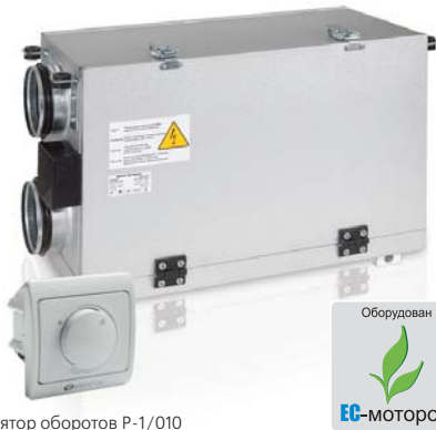
Регулятор оборотов P-1/010